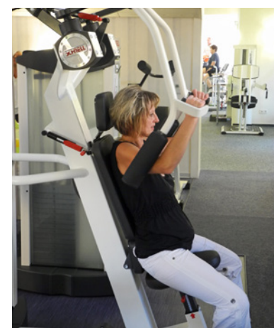
Bei vielen Patienten wird die Therapie durch medizinisches Gerätetraining ergänzt.

Reha Zentrum Brüderlin Ulrichstraße 21 73033 Göppingen Telefon: (07161) 50465-0 kontakt@bruederlin.de www.bruederlin.de