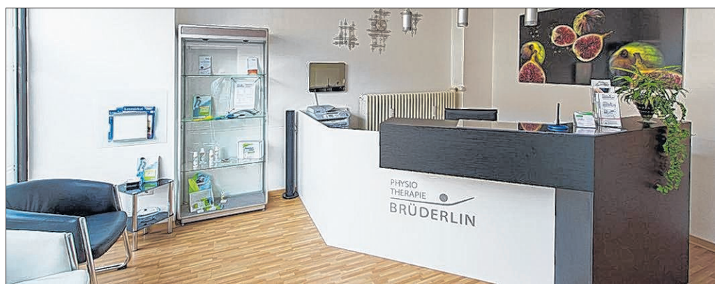
Der neue Empfang in der Nördlichen Ringstrasse.